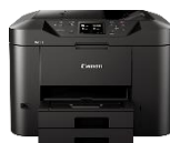
MAXIFY MB5150 Modelle