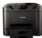
MAXIFY MB5450 Modelle