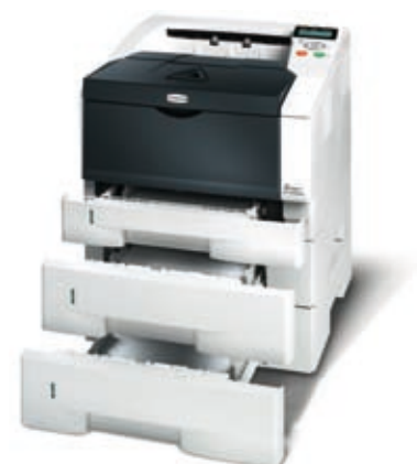
Abbildung mit Optionen.

KYOCERA MITA DEUTSCHLAND GmbH – Otto-Hahn-Str.12 – D-40670 Meerbusch Infoline: 08 00 8 67 78 76 – Fax: +49 (0) 21 59 9 18-106 – www.kyoceramita.de